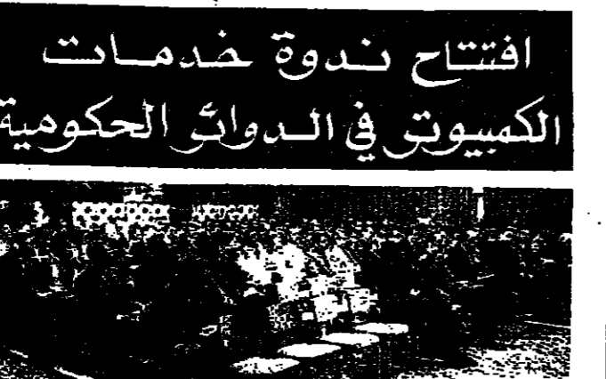
المشركون في مؤتمر خدمات الكمبيوتر

كما مرضى مختلف الممارس التي تتكفل بها الحكومات الحكومية والخاصة، وذلك بهدف مناقشة القضايا التنموية التي تواجه لبنان، وذلك بهدف مناقشة القضايا التنموية التي تواجه لبنان.